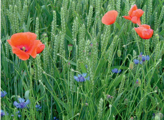
Abb. 14: Klatschmohn ( Papaver rhoeas L.) und Kornblume ( Centaurea cyanus L.) im Winterweizen.

Maßnahmen auf den Artenreichtum und die Zusammensetzung von Ackerwildpflanzengesellschaften sind durch eine Reihe von Untersuchungen belegt (Hald 1999 a; Menalled et al. 2001; Kleijn & Sutherland 2003; Hyvönen et al. 2003; Bengtsson et al. 2005; Hole et al. 2005) und eine Basis aktueller Agrarumweltprogramme.